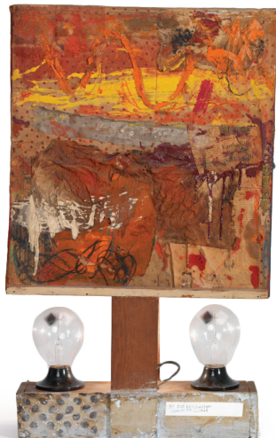
Robert Rauschenberg, Untitled , ca. 1954. Combinación: collage de óleo, tela, periódico y carboncillo con bombilla de luz y dos radiómetros de Crookes sobre una estructura de madera. 25 1/4 x 15 1/2 x 3 3/4 pulgadas (64.1 x 39.4 x 9.5 cm). © Robert Rauschenberg Foundation / Con licencia otorgada por VAGA en Artists Rights Society (ARS), New York. RRF Número de Registro 54.024